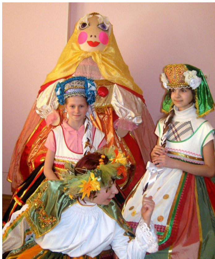
«Делай, доченька, добро и бросай его в воду. Добром, как солнышко, согревай людей. И постарайся всегда улыбаться. Тогда все у тебя получится. Мама»